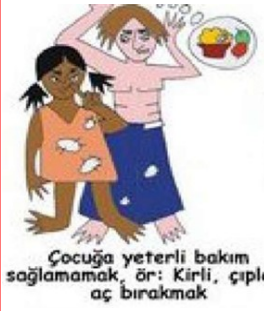
Çocuğa yeterli bakım sağlamamak, ör: Kirli, çıplak aç bırakmak

İhmal çocuğun beslenme, giyinme, barınma, tıbbi bakım, eğitim veya uygun gözetim gibi temel ihtiyaçlarını ve karşılanmayan duygusal ve psikolojik ihtiyaçlarını, eğitimsel/bilişsel ihtiyaçlarını karşılamakta başarısız olmak ve uygun büyüme ve gelişim konusunda denetim eksikliği göstermektir. İstismara göre daha yaygındır ama onun kadar çarpıcı değildir. Tüm dünyada çocuk nüfusunun %1-2'si ihmal edilmektedir.