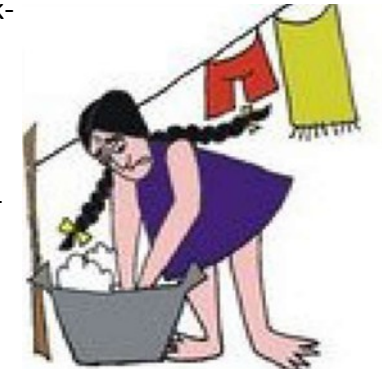
Çocuğu hizmetçi gibi kullanmak

Çocuğa kasıtlı olarak zarar vermek demektir. Çocuğun yaşamını tehlikeye sokabilir ve uzun dönemli olumsuz etkilere neden olabilir. "Türkiye'de yapılan bir araştırma sonucuna göre fiziksel istismar en sık 4-6 yaş arasında olmaktadır ve erkek çocuklar kız çocuklara göre daha fazla istismara maruz kalmaktadırlar". Fiziksel istismar çocuk istismarının en çok görünen ve yaygın şekilde fark edilen biçimidir.