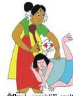
Öfkeyi, gerginliği azaltmak için çocuğu örselemek, itip kakmak

Fiziksel istismar çocuğun kaza sonucu oluşmamış ve fiziksel zarar görmesiyle ortaya çıkan yaralanmalardır.