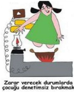
Zarar verecek durumlarda çocuğu denetimsiz bırakmak